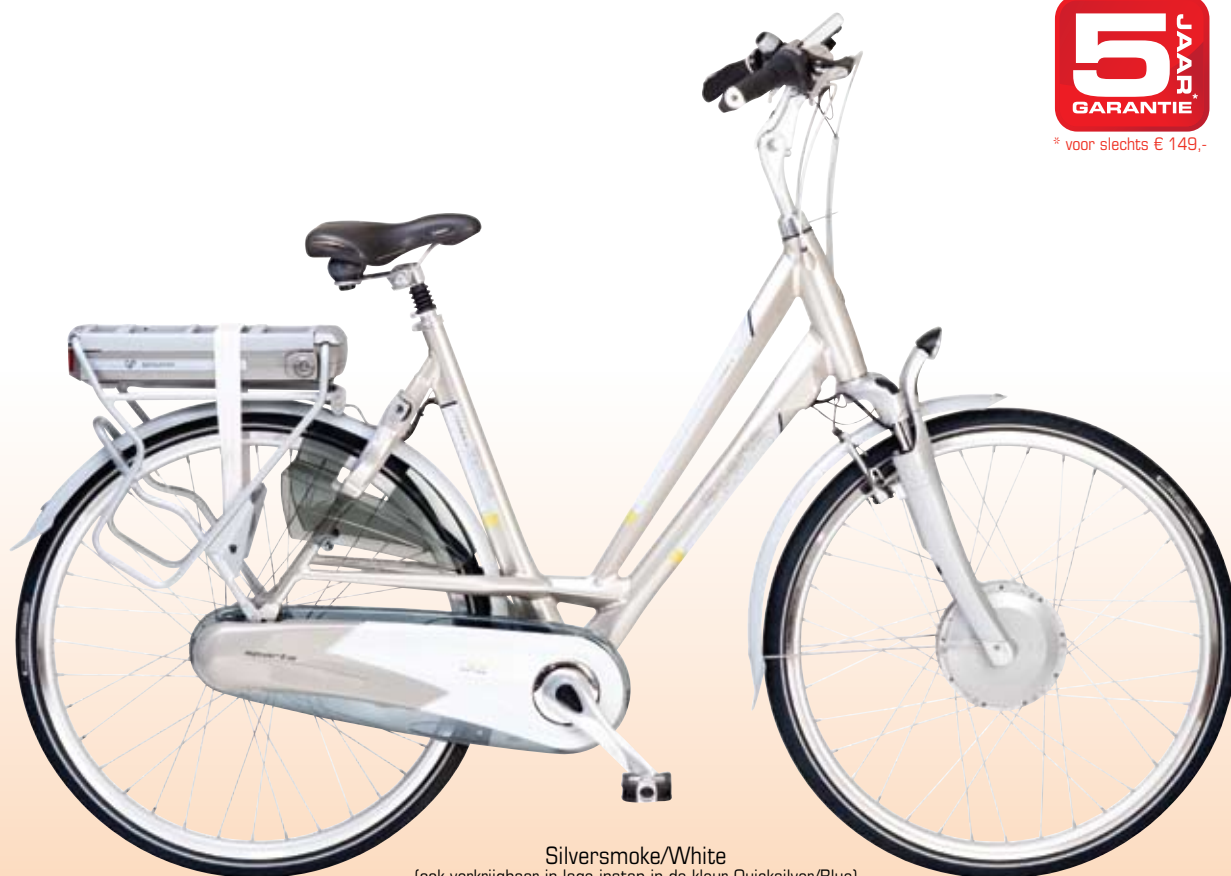
Silversmoke/White (ook verkrijgbaar in lage instap in de kleur Quicksilver/Blue)