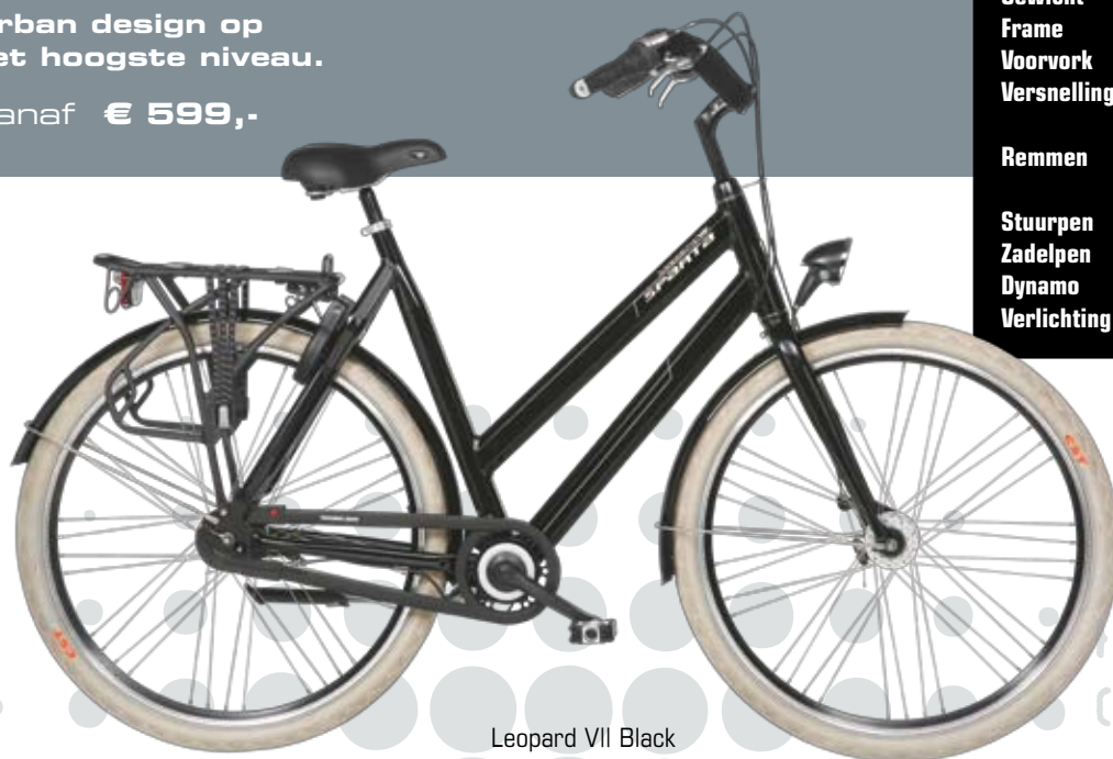
Leopard VII Black