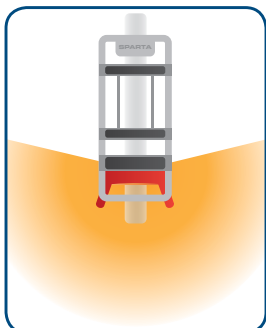
Optimale zichtbaarheid en veiligheid met het 3D Safety Light.